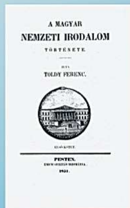
A magyar nemzeti irodalom története, 1851, Toldy Ferenc

1833-41 között az orvosi karon a diétetika rendkívüli tanára volt, jeles könyvét sokáig használták az egészséges életmódra nevelés vonatkozásában az egyetemen. 1841 és 1860 között a Kisfaludy Társaság igazgatója volt, ezen kívül egyéb tevékenységei mellett Bugát Pállal szerkesztette az Orvosi Tár című folyóiratot. Nagy vívódást jelentett életében az irodalmi és az orvosi pálya közötti választás, de végül az irodalomtörténet mellett döntött. Szépirodalmi munkáin túl főleg az irodalmi élet szervezése területén tevékenykedett. Ettől függetlenül, nem szakadt el az orvostudománytól, és az 1850-es és 1860-as években a különböző orvosi tudományos rendezvények résztvevője lett.