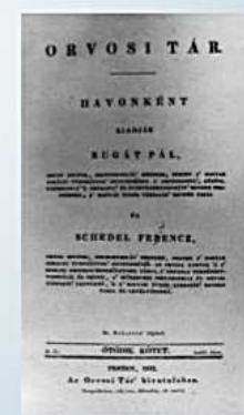
Orvosi Tár, Bugát Pál és Toldy Ferenc szerkesztésében