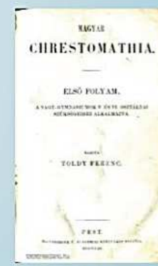
Toldy Ferenc, Magyar Chrestomathia, 1853.

Az országos közoktatási tanács tagja és egyetemi osztályának elnöke, továbbá a magyar királyi gimnáziumi tanárvizsgáló bizottságnak tagja volt, több bel- és külföldi tudóstársaságnak levelező, illetve választmányi tagja, s több vármegye táblabírája is volt. Számos tankönyvet és szöveggyűjteményt publikált, alapítója volt a Kisfaludy-társaságnak, amely a korabeli írók - köztük Petőfi és Arany - leghatékonyabb támogatója volt. Igazgatta az Egyetemi Könyvtárat, tagja volt az Akadémiának.