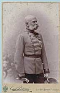
I. Ferenc József (1816-1930)