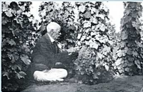
Mindig a szőlőben

Levezett a korának jelentősebb nemzetközi kutatóival, cikkeket írt hazai és külföldi szakajtóba. Minden idejét a szőlőben töltötte, mert vallotta, a szőlészkedés egész embert kívánt. Mindent elemzett, mért, kísérleteit pontosan dokumentálta, irdatlan energiát fektetett a munkába. Katonatelepi szőlője lényegében egy hatalmas, élő laboratórium volt. A szőlészkedést nem munkájának, de hobbijának és hivatásának tartotta. Sosem kötött kompromisszumot, nem fogadta el az orosz cár csábító ajánlatát. Rajongott érte a szakma, a termelők, pár miniszter és sorolhatnánk, de sajnálatos módon életében elmaradt a magyar kormány elismerése. Emléke előtt tisztelegve és tevékenysége elismerésül Kecskemét városa 1972-től Mathiász János díjjal jutalmazza a szőlészet terén kiemelkedőt alkotó személyt vagy munkacsoportot.