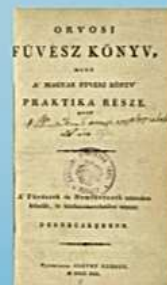
Orvosi fűvészkönyv, 1813