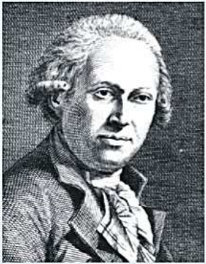
Gmelin János Frigyes, Diószegi göttingai professzora

Diószegi Sámuel 1760. december 29-én született Debrecenben a Csapó utcában. Közép- és felsőfokú tanulmányait is Debrecenben végzi. 1783. szeptember 15-én diáktisztviselő, majd megbízzák a poétai osztály vezetésével. 1784-ben Böszörménybe megy rektóriára, három évig írásra, számolásra, olvasásra tanítja a gyerekeket.