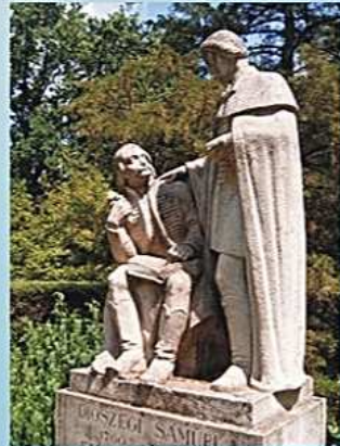
Diószegi Sámuel és Fazekas Mihály szobra Debrecenben

1799 januárjában nagy kitüntetés éri, a Brockhauseni Természetvizsgálók Társulata tagjai sorába választja a szerény református prédikátort. Diószegit 1803. március 19-én választják meg papnak Debrecenben, és 1813. augusztus 2-ig, haláláig itt élt.