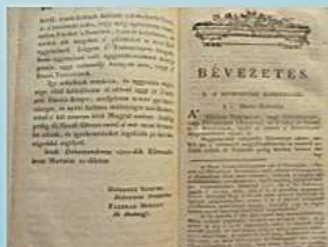
A Fűvészkönyv bevezető lapja