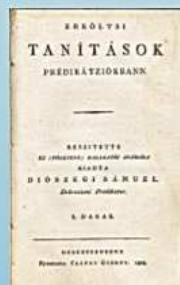
Erköltsi tanítások Prédikációkban, 1808